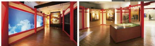
清盛の夢の都をコンピュータグラフィックやジオラマにより再現した「幻の福原京ゾーン」