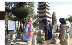
清盛ゆかりの地を巡る「歴史ガイドツアー」