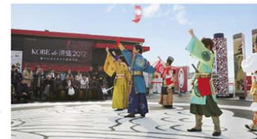
清盛隊のライブをはじめ、さまざまな催しが行われるイベントスペース